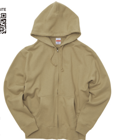
5213-01 537 サンド カーキ