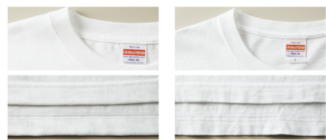
未着用の5001-01(左)と、1年間着用した5001-01(右)

5.0~7.0オンスが一般的に「ヘヴィーウェイト」とよばれる生地厚で、「5.6オンス」は一枚で着用できるちょうど良い生地感と強度を兼ね備えています。丈夫で長く着用できるので、洗濯を繰り返してもへこたれません！