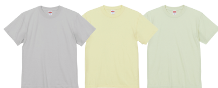
2022SSから新たに登場した期間限定色の「リミテッドカラー(全3色)」

「みんなでのおそろいのTシャツを作りたい」「店舗スタッフのユニフォームに」といった需要には、カラバリの豊富さで答えます。コーポレート・スクールカラーにも答えられる54カラーのラインアップにはきっとお探しのカラーがあるはずです。